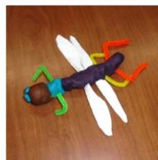
正しい体のつくりになっているだろうか？